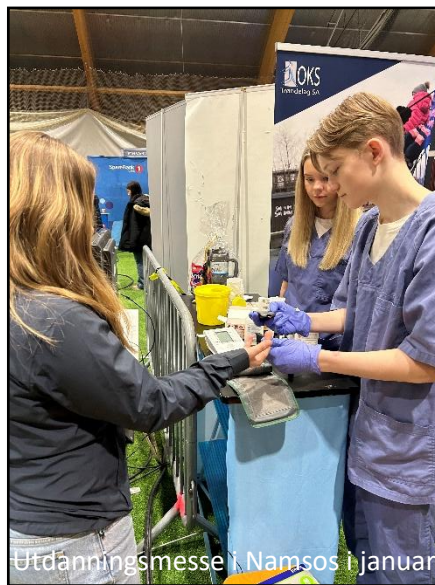
Utdanningsmesse i Namsos i januar