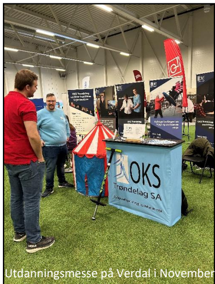
Utdanningsmesse på Verdal i November

Opplæringskontoret OKS Trøndelag SA har også i 2025 deltatt på utdanningsmessene i området vi rekrutterer fra, der vi har møtt ungdomsskoleelever, elever fra videregående og delvis andre arbeidssøkere og foreldre.